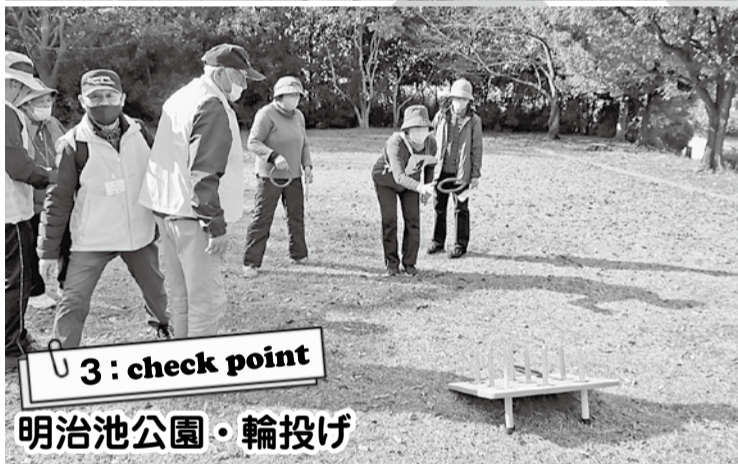
3: check point