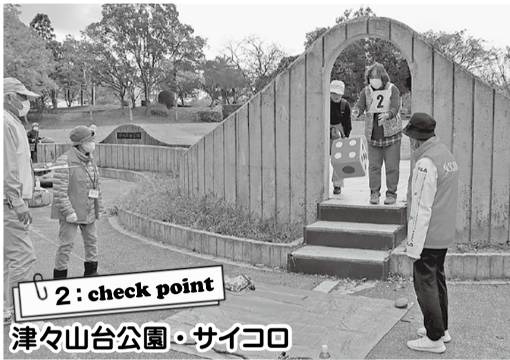
2: check point