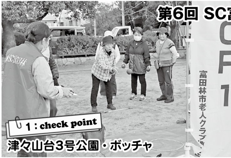
1: check point