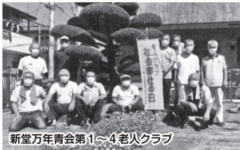
新堂万年青会第1~4老人クラブ