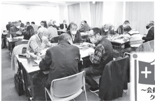
プラスワン 友だち入会作戦 ～会員一人が、一人の友だちにクラブ入会の声かけを～

11月29日、SC大阪主催の表記研修会に出席してきましたので、その報告をします。