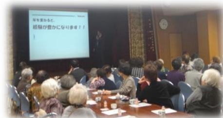
老人クラブ・いきいきサロン