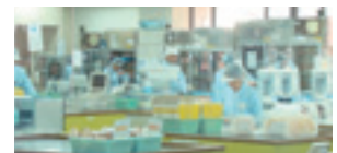
採血から血液製剤の製造過程、血液製剤の供給体制などについて説明を受けました。