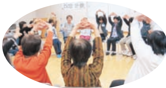
▲とんとん体操、健康体操、脳トレーニング、遊びリテーション 笑って楽しく、でも、しっかり予防を目的に、4つのメニューを体験してもらいました。「ぼっちら教室（介護予防教室）」の出前教室で体験してもらえます。