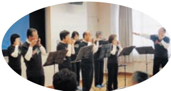
▲プカプカバンドさんによるハーモニカ演奏 (秋の童謡メドレーから流行のアニメ（崖の上のポニョ）まで多彩な演奏をして頂きました)

当日の午前中には、市内のボランティアグループ「プカプカバンド」さんによるハーモニカ演奏で和んで頂いた後、「知ってください高齢者を取り巻く状況」「はつらつ生活！のぼそう健康寿命」と題した講演会を開催しました。