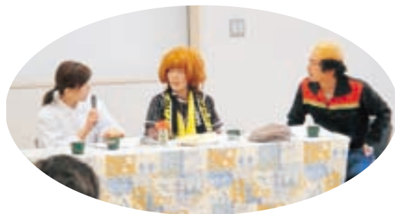
▲介護劇「みんなで安心！地域でささえるあったか介護」 当日のイベントに協力頂いた在宅介護支援センター・いきいきネット相談支援センターの皆さん。説明用紙を見るより、劇を見たほうがわかりやすいと好評でした。現在地域で開催している「ぼっちら教室（介護予防教室）」の出前教室で、見て頂く事もできます。社協の第2圏域ほんわかセンターまでお問い合わせ下さい。